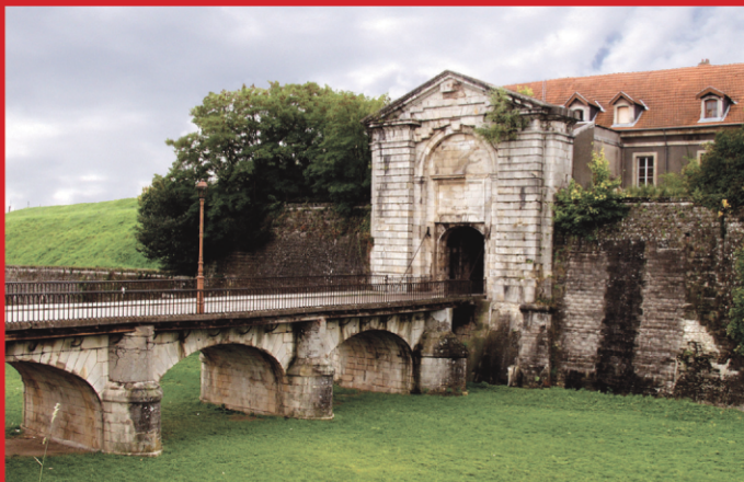
Porte de Metz

The history of Toul's fortifications already started in the times of the wars between Gauls and Romans. In the 4th century the inhabitants of the town of Toul erected a wall of 12 m height to protect themselves against raids of ancient Germanic tribes. This was converted in the 13th century into a typical medieval defensive wall for the town which had grown in the mean time. In the 17th century the French fortress builder Vauban enriched the fortifications with bastions. The borders of France were changed by the German/French war of 1870/71. Therefore the French military engineer Séré de Rivières made Toul into a vast fortified camp, like also the towns of Verdun, Epinal and Belfort. The authors describe in detail the planning and building of this large fortress. They also show the reforms of French artillery necessary after 1871 and its development and mode of operation until WW I. Closely connected to the extension of the fortifications is the growth of the French air force and Toul becoming an important airfield, both described in the book. The authors illustrate all this with photos of their own and old picture postcards, as well as new plans of all fortifications they have specially drawn for this book. All this combines to a magnificent book not only about fortified Toul but also French fortifications and their weaponry from the 1870s to WW I. Don't miss it.